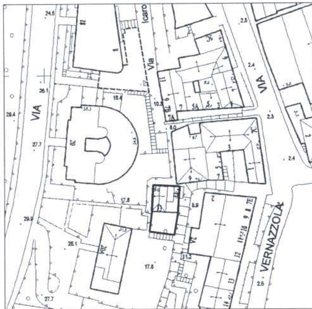
Stralcio della Tavola di Rilievo Comunale