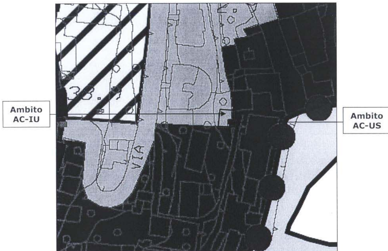
Stralcio della Tavola 3.9 - Progetto Preliminare di P.U.C. adottato con D.C.C. n. 92 del 07/12/2011

A handwritten signature in black ink, appearing to be 'G. De...'. The signature is written in a cursive, flowing style.